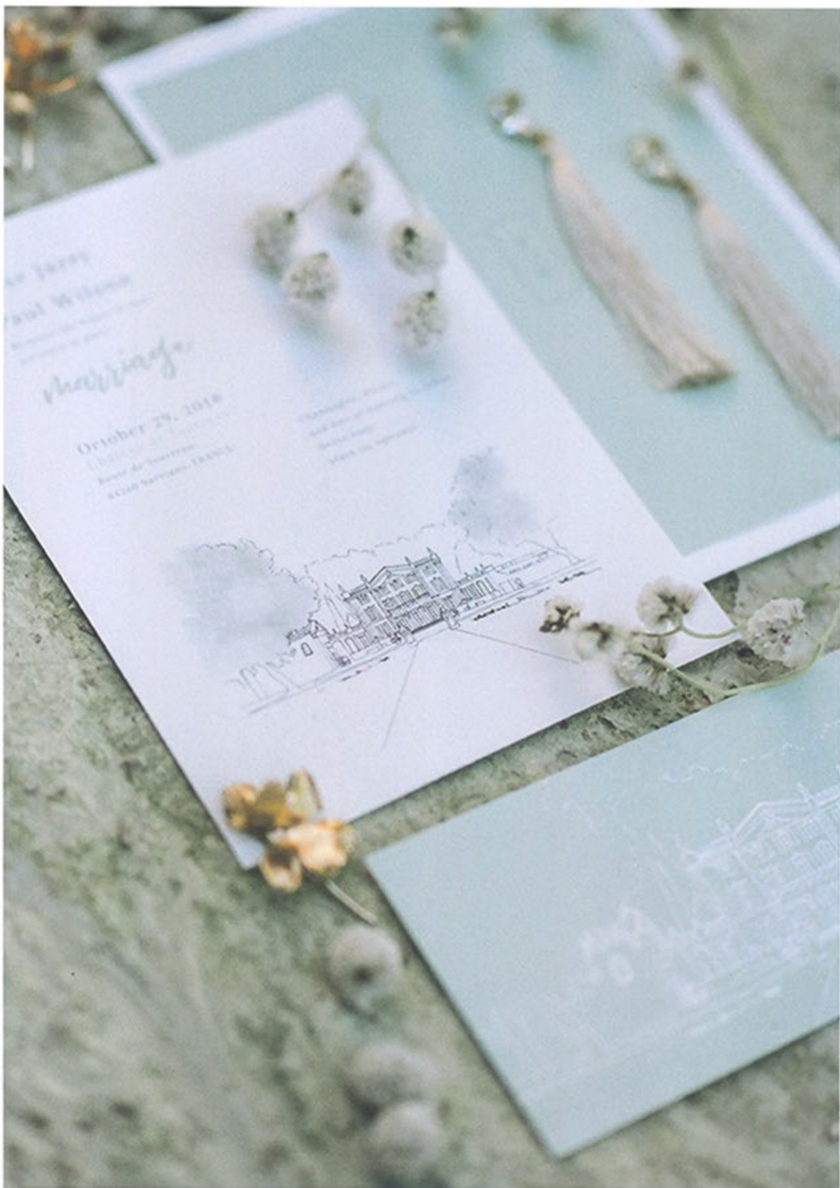
131 CHATEAU ROMANCE